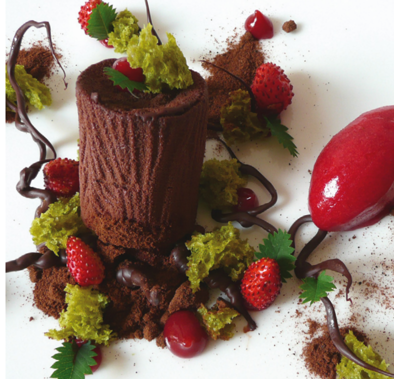
Vom Feinsten: TERIYAKI LACHS Thaispargel, Rettich, Granatapfel / WALDRAND Erdbeer, Dulcey, Pistazie